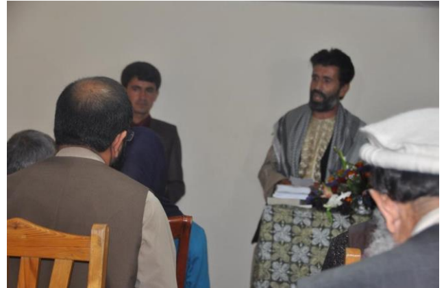
مولانظر حق دوست