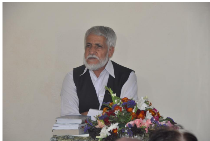
پروفیسور خلیل الله اورمر

بدین ترتیب در موقع بعدی پروفیسور سید محی الدی هاشی و بعد از آن پروفیسور خلیل الله اورمر نیز در باره رشد زبانها محلی وصحبت های خود را داشتند.