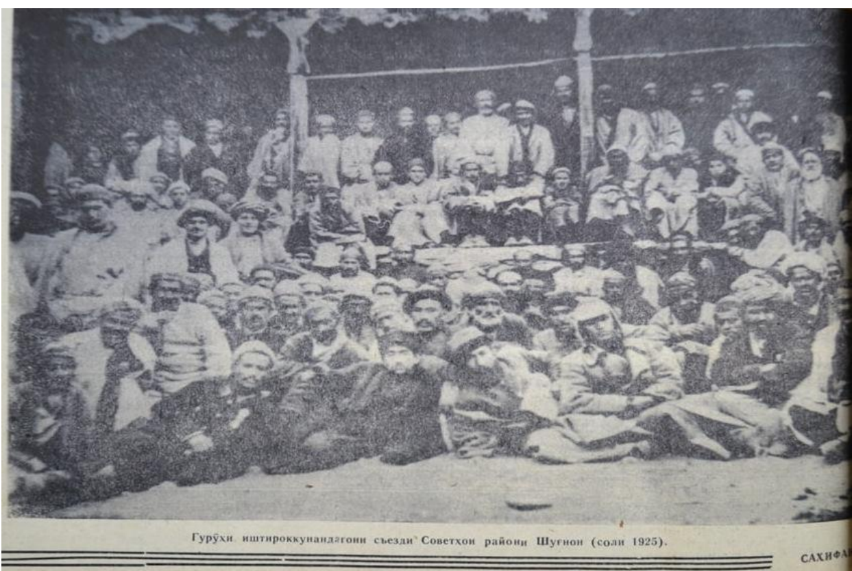
Гурухи иштироккунандагони съезди Советхон райони Шугнон (соли 1925).