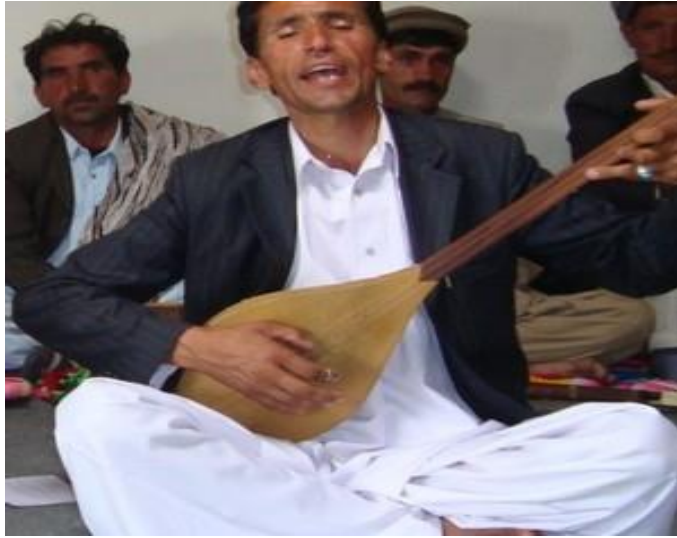
مهری مفتون، آواز خوان مشهور افغانستان

همچنان از آقای داود "پژمان" و سلام جان "پامیری" و همراهان شان که خوب درخشیدند، میخوایم باز هم کوشش بیشتر نمایند تا خوبتر تجلای فرهنگی منطقه را تمثیل نموده باعث افتخارات وطن گردند و ما را از چشمه ذلال فرهنگ و هنر موسیقی نیاکان جام های رنگین حقیقی و مطابق به معرفت آنرا نصیب گردانیده سیراب نمایند.