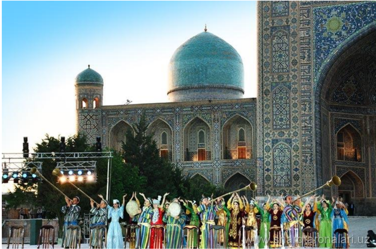
فستیوال "موسیقی شرق" در شهر باستانی سمرقند-۲۰۱۳