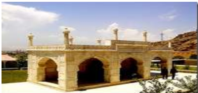
د بابر شاه د بن یوه ښکلی مرمینه بنا

په دی سلسله کی زمونږ په هیواد دا کلتوری اداره له کابل نه تر هراته پوری فعال دی. د