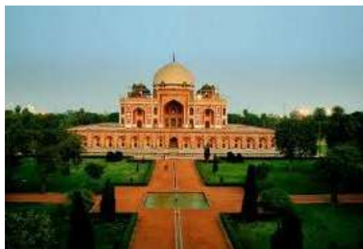
په هند کی د مغل یادگاری بنا