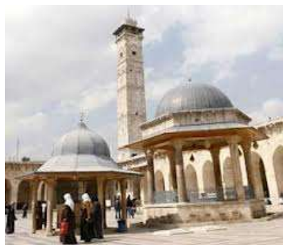
په سوریه کی یو تاریخی مرکز